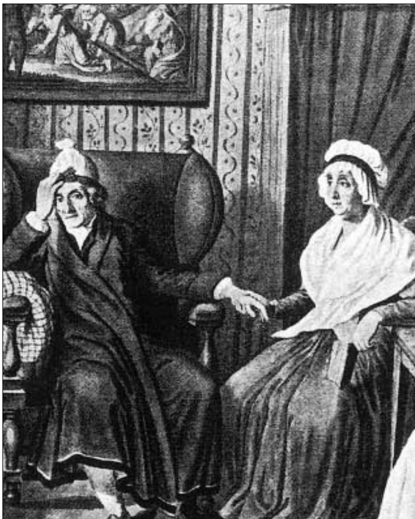
Johann C. Lavater ha averti: «Liberescha nus da questa libertad da l'enfiern!»

La voluntad da la populaziun da sa defender tschessava. Ins cumenzava a crair dapli en ils avantatgs ch'en ils dischavantags d'in'invasiun franzosa. Anc davi en quest regard ils reacziunaris. 1798 en fugids blers da quests conservativs a l'ester segir. Bandas d'uschedits patriots, da fanaticheis cun in pensar modern ed ina cretta en il progress