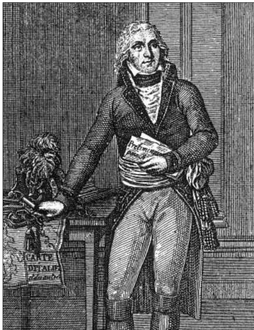
André Masséna, il cumandant da las armadas franzosas en Svizra.